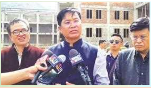
মণিপুৰ লৈগাকী আৰ্ট এন্ড কলচৰ অমদি টুৰিজম মিনিষ্টৰ খুৰাইজম লোকেননা ইফ্ৰাল ইষ্ট দিষ্ট্ৰিক্টী মনুং চমা লৈবা ৰাখদা মণিপুৰ য়ুনিভাৰ্চিটি ওফ কলচৰ (এম য়ু সি) গী শেমগং শাগংপগী থবক য়েগ্ৰেশনবা