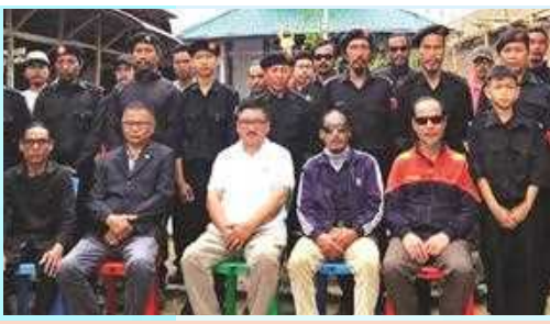
য়ু এফ ও হৈবাক ১ লংখবাল ফুৰামখোঙ বটালিয়নগী মনুং চমা লৈবা য়ু এফ ও উংলৌ ব্ৰাঞ্চী ২৮ শ্ববা ৰাইজিং দেগী থৌরমদা শরুক য়াখিবশিং