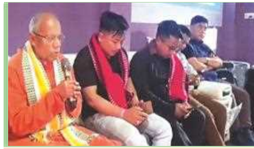
প্ৰেম ধাৰানা শীন্দনা ৰাষ্ট্ৰীয়া স্বায়মসভক সঙ্ঘ (আৰ এছ এছ) গী চহী ১০০ মপুং ফাৰকপগী লেগুনা চখরকপা থৌরমগী শরুক অমা ওইনা হৈরোকতা পাঙথোকবিবা পঞ্চ প্ৰিভাৰ্তনী এৰাৰ্ণেস শ্ৰোগ্ৰাম