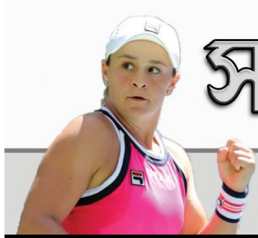
এ টি পি-দল্লিউ টি এ এদিলাইদি ইন্টৰনেছনেল টাইটেল লৌশ্ৰবী অষ্ট্ৰেলিয়ান টেনিস শাশ্নৰোই এল্লি বারটি