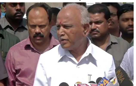
লৈতৰা অৱবদি মহাকী ফম অসিদা য়াদুনা লৈনবগী মাগী অনীংহা লৈতে হায়খি।

অদুম ওইনমক চীফ মিনিষ্টৰ কুমাৰা শ্বামিনা ষ্টেট এসেমব্লিৰা এলায়েন্স অসিদা মখৌতাবশিং অদু