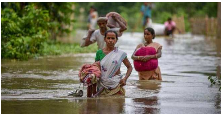
ভাৰাহাটি, জুলাই ১৩(এজেন্সি): অসামগী দিষ্ট্ৰিক্ট ৩৩গী মনুন্দা ২১ কুমগী ঈচাওনা থুমখিৰবা লোয়না ষ্টেট অসিদা ঈচাওগী ফিভম লুশিল্লকশ্ৰে, মীওই ৬ শিখ্ৰে অমসুং মীওই লাক্ষ ৮ হেনা শোকশ্ৰে।

মায়েলমগী মনুন্দা ষ্টাইদগী চাওবশিংগী মনুন্দা অমা ওইৱিবা ব্ৰহ্মপুত্ৰ তুৱেলনা ষ্টেট অসিগী