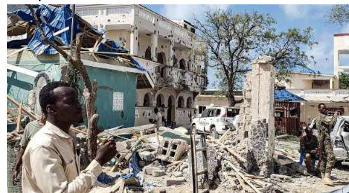
লৌবা টেৱেৱিষ্ট অদু নোইমনা কাথুনা হাংগ্ৰে হায়না সেকুৱিটি ওফিসিয়েল মোহমেদ অবদিৱেলিনা হায়খি।

হৌজিক ফিভম অদু সেকুৱিটি ফোৰশিংগা লাক্ষিগ্ৰে অমসুং ইৱাই