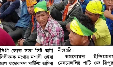
অসিগী লোক সভা সিট অনী

স্টেট অসিনা মতম পুথদা য়েলহৌমিশিংনা মীখলদা অচৌবা থৌদা অমা লৌবা মরুনা লোক সভা মীখল চয়াল খরদা উইশিলক্ৰবদা মতমসিনা ত্রিপুরাগী ট্রাইবেলদা য়ুমফম ওইবা পার্টিশিংদা অহেনবা মীংয়েং থম্বরকব্রহে।