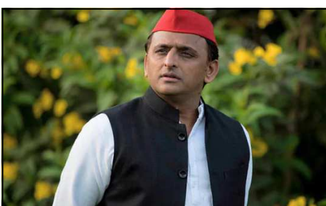
লখনৌ মার্চ ১৫

নেসনেল ইলেক্সন পাংথোকদবা হয়েঙদা উইশিলক্ৰবদা সমাজৱাদি পাটি চীফ অখিলেশ যাদবনা কোংগ্রেসদীমক পাউতাক খরা পীর অমসুং অক-অকুম ফন-য়ান্ন লৈদনু মথোয়গী এলায়শিং লেজেন্দা থম্বিবা বি জে পিদিগী পেরা