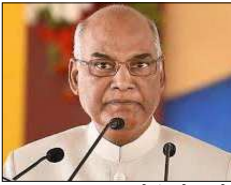
পাণ্ডিনগর, মার্চ ১৫

লৈবাক অসিনা ময়োক্রুরিবা নুনাবেশিংগী বারোইশিনশিং ফংনবা ইনোভেসনগী শক্তি অদু শিজিন্সি মথোয়বা অমা লৈবাক হায়না উসি ইরাই নুমিৎতা প্রসিডেন্ট রামনাথ কোবিন্দনা হায়শ্রে।