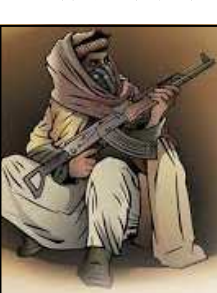
নু নিরি, মার্চ ১৫

জম্মু এন্ড কাশ্মিৱা লৈরিবা লালহৌ অসিনা মতেঙ পানচবা পাকিস্তান চৌ কয়ামক্ৰমদগী হৌনা টেরোৱিষ্টগী শিজিন্সি হায়বসি অৱোনবা নহে।