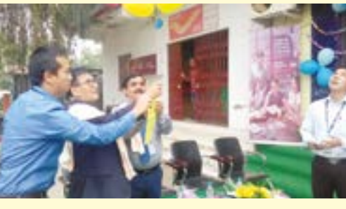
কাঞ্চিপুৰদা লৈবা ষ্টেট বেঞ্চ ওফ ইন্দিয়া (এস বি আই) মণিপুৰ যুনিভাৰ্চিটি ব্ৰাঞ্চনা শীন্দুনা ব্ৰাঞ্চ অসিদা 'য়োনে কেশ'কী খুদোচাৰা ফঙহনবা হৌদোকপা খৌৱমগী শক্তম অমা