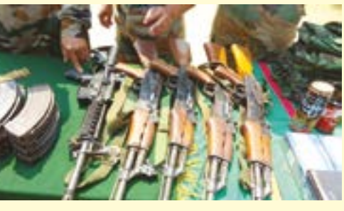
চুৱাচান্দপুৰ দিষ্টিক্টকী মনুং চনবা পাৰ্ভুও এৱিয়াদগী অসাম ৱাইফলসকী কাঙৰু অমনা ফাৱৰা মাৱ পীপলস কনভেন্সন (এচ পি সি-দিমোফ্ৰেসি)গী কেন্দ্ৰ তৰেংতগী ফাগংলকখিবা য়াচুৰা খুংশু-খুংলাইশিং

Volume No: 43 Issue: 108 IMPHAL SATURDAY 16 MARCH, 2019 খাংজ, লমতাগী ১০ নি পানবা RNI Regd. No. 31350/77 PAGE: 8 Price:Rs 3.60