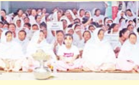
সিক্কিমগী ৱানীপুলগী মফম অমা অশিবা হকতাং ওইনা ফংখিবা প্ৰো অডোম ইঙোচা মীশিগী অচুয়া লংলা- লংজিন পুথোকট হায়বা দিমান্দ তৌৱদুনা ফেয়েংবা ফমখিবা ৱাকং মীফম