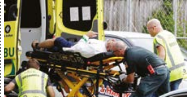
শ্বষ্টে, মাৰ্চ ১৫ (এজেসি): নু জিলেন্দগী শ্বষ্টেচতা লৈবা মোস্কু অনীদা মতম ইকান-কাৱদনা ইন্দিয়াগী পুংফদা ঙসি অমুক চখখিবা টেৱেৱিট এটেকতা ৱামত্ৰবা মীওই ৪৯ শিৱে অমসুং ২০ হোয়া শোৱে। এটেক অদুগী মতাংবা ফঙবা পাউনা হায়, অলনুৱ মোস্কুদা চখখিবা টেৱেৱিট এটেক অদুদা মীওই ৪১ শিৱি অদুগা লিনকু মোস্কুদা চখখিবা এটেক অদুদা মীওই ৮ শিৱি। যৌদোক অনীদা মীওই ১০/১০ শোকখি। নোইমে পায়বা মীওই অমনা অল-নুৱ মোস্কু মনুং চৰ্শিৱল্লা অনকপা মফম অমদগী নুপা, নুগী অমসুং অঙা শিৱা ওশিৱল্লা নোইমে কাপশিনবা উখি। মীওই অদুনা নোইমে কাপুগা মী হাংপগী ডিডি ফুট্ৰেজিং কনাঙুৰা অমনা ফেসবুক থাংলকখি। অদুৱ অদুগুৰা মখলগী ডিডি ফুট্ৰেজ অদু পুসিনা থাংলকখি। কায়নথুদা লৌখোকখি। প্ৰাইম মিনিষ্টৰ জিন্দ অৱৱেননা জুসিগী যৌদোক অদু টেৱেৱিট এটেকতা