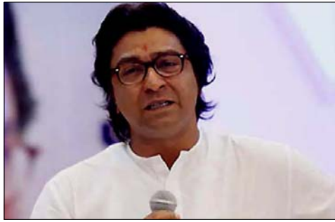
মহাৰাষ্ট্ৰ নতানিয়ন সেনাৰী প্ৰসিদ্ধে ৰাজ থাক্ৰ