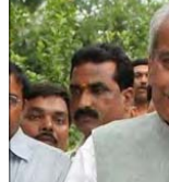
নুৱা সিত্তি, মে ২০১৭

আৰ জে দিগী হান্মগী এম এল এ প্রভুনাথ সিংহ মপুসি চুল্লা ফাদোক তাবগী দন্দি পীথ্ৰে