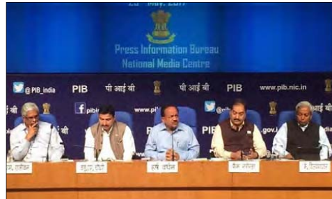
নুৱা সিত্তি, মে ২০১৭

কাউন্সিলৰ ওফ সাইটিকিক এন্ড ইনষ্ট্ৰুমেণ্টাৰি (সি এছ আই) আৰনা প্লাষ্টিক ৰেষ্টৰণী ডিজল পুথোক্ৰবা টেকনোলজি পুথোক্ৰে অৱিয়ানা গ্ৰান্দ কন্সৰ্টোত সুসাইদ বোম এটেস্ট চখরকপদা ২২ শীৰে