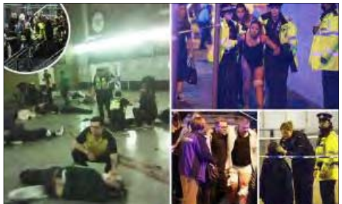
নুৱা সিত্তি, মে ২০১৭

ইং ২০২০দা লৈবাক অসিগী পোথোক-চাপোককী চাং হাৱদনী শৰক ২ ওইহোম হায়াৰ পা দম অৱ ফৰনা হোমোকাৰ সাইস অমসুং টেকনোলজি অটোবা হোমো লোৱি।