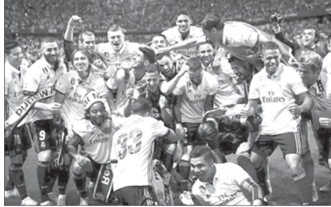
ৱিয়েল মাদ্ৰিদনা মালাগা পাঞ্জল ২-০ দা মায়থিবা পীদুনা লা লীগগী টাইটেল ৩৩ ৩০ ৩০ ৩০ ৩০

ৱিয়েল মাদ্ৰিদনা মালাগা পাঞ্জল ২-০ দা মায়থিবা পীদুনা লা লীগগী টাইটেল ৩৩ ৩০ ৩০ ৩০ ৩০ ৱিয়েল মাদ্ৰিদনা মালাগা পাঞ্জল ২-০ দা মায়থিবা পীদুনা লা লীগগী টাইটেল ৩৩ ৩০ ৩০ ৩০ ৩০