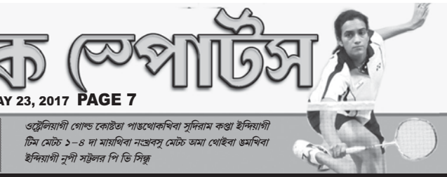
ওন্টোয়াগী গোল্ড কোটতা পাডথোকপা সুদিরাম কপ্প ইন্দিয়াগী টিম মেটে ১-৪ দা মায়থিবা নত্ৰবসু মেটে অমা থোইবা উমথিবা ইন্দিয়াগী নুপি সটলৰ পি ভি সিন্ধু