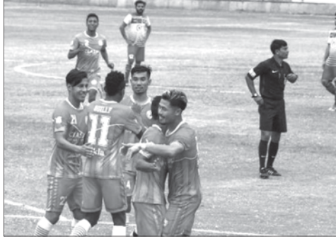
নোৰোকা এফসিনা লোন ষ্টাৰ কাশ্মিৰগী মায়থিবা পাঞ্জল ৪-১ দা মায়থিবা পীদুনা আই লীগ সেকেন্দ দিভিজনগী টাইটেল লৌখে

মণিপুৰগী নোৰোকা এফসিনা লোন ষ্টাৰ কাশ্মিৰ পাঞ্জল ৪-১ দা মায়থিবা পীদুনা আই লীগ সেকেন্দ দিভিজনগী টাইটেল লৌখে মণিপুৰগী নোৰোকা এফসিনা লোন ষ্টাৰ কাশ্মিৰ পাঞ্জল ৪-১ দা মায়থিবা পীদুনা আই লীগ সেকেন্দ দিভিজনগী টাইটেল লৌখে