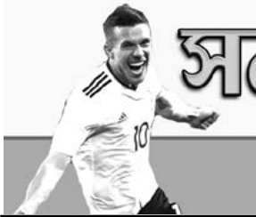
জর্ডান অমসুং ইন্ডোনেশিয়া শাৰখিবা পেনাল্টি মেটচ অমদা জৰ্মনীৰী মার্কেদেদী পাঞ্জল চনবা ডুমখিবা বুকস পোলোষ্টিনা পাঞ্জল চনবা মচু হৰাওনা হেডেচকাৰা চেংসকৰণ