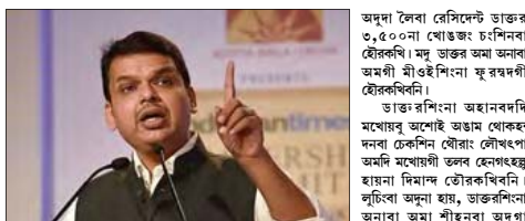
ফুফু, মাৰ্চ ২৪

মহাৰাষ্ট্ৰীনা ডাক্তাৰ লিখিং কৰানা নুমেং এনি টুপা খৌঙজং চশিল্লিকৰিবা মৰম ওইৰগা চেষ্টে অমদা খুংগেং দাবা কৰা মায়োৰেজ। চীফ মিনিষ্টৰ কেণ্টেন ফৰনাবিসনা ডাক্তৰশিং অথবা মতমবা মৰৌবা। হজ্জিনবদৰদি নতৰবি লিগেল এজেন মায়োৰেজনি খাঙ হাঙহলং।