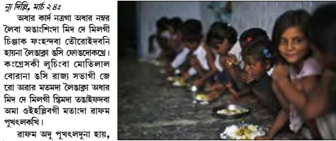
নু দিদি, মাৰ্চ ২৪

অপাৰ কৰ্দ নত্ৰগা অপাৰ নম্বৰ লৈবা অঙাংশিংদা মিদ দে মিলগী চিঞ্জাক ফংখেনবা হৌবকৰিবা। হায়না লৈজাৰু উসি ফৌঙদোকশ্বে। কমেসেচী হুটিংবা মেডিভাল বোৱানা ওসি ৱাজা সভাগী জে লৈ অৱাৰ মতমদা লৈজাৰু অপাৰ অমা ওইৰেইবৰগী মতামো ৰাফম পুংলকৰি।