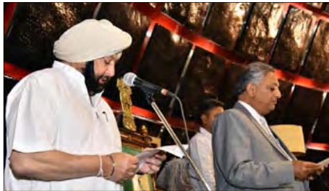
চলিঙ্গ, মাৰ্চ ২৪

লৌনা খঞ্জৰ পঞ্জাবী এম এল এ অমসুং চীফ মিনিষ্টৰ কেণ্টেন অমরিন্দর সিংহ ৩ সি পঞ্জাব এসেমব্লীৰী ১৫শতা মীফম হৌশ্বে অসেনাৰা নুমেতা রাশক লৌশ্বে। অমৰ এমকেম হায়গী পঞ্জাবী চীফ মিনিষ্টৰ প্ৰকাশ সিংহ বাদল অমসুং মাহীৰী মাদুনা হায়গী দিগুটি সি এম সুখবৰ সিংহ বাদলদি মফম অম হৌবলকৰা হায়গী লৌশ্বে।