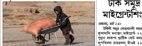
ফুফু, মাৰ্চ ২৪

পাকিস্তানৰী অকনবা শাসু পীৰকৰনা মৰম ওইৰগা মীওই কৰা শাৰবা নিভড ওইতম্বা অমসুং মফম হৌদনা চেম্বিনা মৰম ওইৰগা হেজিৰি চৰী অমিলা অফগানিস্তানদা মইৰে মশিং তম্বা ফংদে। অঙাং ৪,০০০০০ লৈৰি হায়রি।