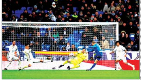
ৱিয়েল মাদ্ৰিদগী মাজেতা মায় পাকপগী পাঞ্জল চনবা ডুমথিবা জোনি কেপ্টোনা বেল কৰ্ডিন্সিমা

ৱাল্ৰ্ছ, জুলাৰী ১১ ৪ স্পেনগী ফুটবল ক্লাবগী ৱী টুৰ্নামেণ্টগী মনুৱা অনীশ্ববা ৱাইল্ড কাৰ্ড এন্ট্ৰি ওইনা চঙলকথিবা উজবেকিস্তানগী শাৱৰোই দেনিস ইষ্টোমিনগী মখুত্তা মায়থিহোৱে চৰী অসিগী মনুৱা গ্ৰাম প্ৰেম ট্ৰেন্সিষ্টেণ্ট ওই ৱিবা. ওষ্ট্ৰেলিয়ান ওপন চেমিফাইনালত অসিগী টুৰ্নামেণ্টৰ লৈহোৱে।