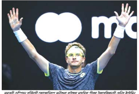
মাত্ৰগী চেম্পিয়ন সৰ্ভিযাগী জোকোভিসপু অনীশ্ববা ৱাউন্দ মায়থিবা পীৱৰা উজবেকিস্তানগী দেনিস ইষ্টোমিন

বেলগৰী, জুলাৰী ১১ ৪ ৱাল্ৰ্ছ নম্বৰ টু সৰ্ভিযাগী নোবাক জোকোভিস ৱাইল্ড কাৰ্ড এন্ট্ৰি ওইনা চঙলকথিবা উজবেকিস্তানগী শাৱৰোই দেনিস ইষ্টোমিনগী মখুত্তা মায়থিহোৱে চৰী অসিগী মনুৱা গ্ৰাম প্ৰেম ট্ৰেন্সিষ্টেণ্ট ওই ৱিবা. ওষ্ট্ৰেলিয়ান ওপন চেমিফাইনালত অসিগী টুৰ্নামেণ্টৰ লৈহোৱে।