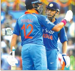
ইন্দিয়াগী মাৰ্কেণ্ডগী সেফ্ৰী লৌথিবা যুৱৰাজ অমসুং ৱেনি

ৱাল্ৰ্ছ, জুলাৰী ১১ ৪ ইন্দিয়াগী ৱন দে মেটচপু ইন্দিয়া ইংলেপবু ৱন ১৫ দা মায়থিবা পীদুনা সেৱিজ ২-০ দা লেশ্ৰে।