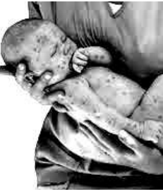
হোংনৰীণৱৰনি ইশিশু খঙিক-খঙিক য়ালা তোয়না পীৰকণীণৱনি। অঙাংশা নংৱগা

মালাশুটিংন হকচাংবা চিঙাক ৰাংলকপা মও ওঁৱৰজ্জনি। অণনা অনাৰা অঙাংশু