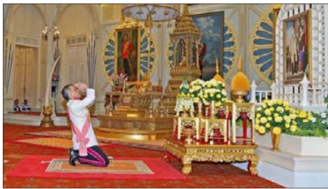
চৌনা কন্থৰা থাইলেন্দগী প্ৰিন্স মহা ভজিৰা লোংকোৰ্ন

প্ৰিন্স মহা ভজিৰা লোংকোৰ্ন (৬৪)না লৌখিবৰা মহাষ্ট্ৰী অঃগৌ পা নিঃখৌ তুমিবোল অদুলাই দেজগী মত্ৰঃ শিন্দুনা থাইলেন্দগী অণোৰা নিঃখৌ ওইহৰে। থাইলেন্দগী নিঃখৌ খুতম অদু পাৰবা য়াৰে হাৰবা ৰাফম লৈকা অদুগী টেলিভিজননা ফোঙাংকৰি। লোয়না থাইলেন্দ পৰ্লিয়ামেণ্টনা ৰাৰ্চন তৌৰকপা মত্ৰঃ হৌনবী মত্ৰঃ ইয়া ফঃখাল কৰণী খৌৰম পাঃখি। মাঃলমগী ওইনা মত্ৰঃ খুইনবী শাঃনা নিঃখৌ ওইহৰা কিঃ তুমিবোল ওষ্ট্ৰেবৰ ১০চাৰি লৈখি। থাইলেন্দনা চৰী ৭০ ৰোম ৰাঃগিটীকী অদু লৈতাৰা ফিড অমা লৈকখিবা অদু হুঃ লৈতাৰা ফিড অমা পুঃকৰা থাইলেন্দ শাঃগিটীকী ওইবা ধৰক টেলিভিভিওই। ক্ৰাউন প্ৰিন্স মহা ভজিৰা লোংকোৰ্ন মহাষ্ট্ৰী অঃগৌপগী মত্ৰঃ লৈকা অদুগী অণোৰা নিঃখৌ ওইহৰনি। থাইলেন্দগী প্ৰাইম মিনিষ্টাৰ প্ৰশ্বঃ চঃপ-গোনা লৈকা অদুগী নিঃখৌ লৈকখি।