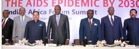
নাটিলি, দিসেম্বা ১৫

চৰী ২০৩০ মতাংদদি ইচি এম অসি একুয়াৰ ইশুনেদা দিফি সেনি কিলেডা (এইচস) কী কেপিটাল অমা ওইহৰগনি হাৰনা ফোঙাংকখিবা লৈখি। অণু ওইনেকম ওসি ফিড অদু লাকশিনবা ৰাঃ। হায়েম ইশুনা দিফি সেনি জইনৰ (এচ আই ভি) লাকশিনবা ওইঃ ইঃ ২০০০দদি লায়চৎ অদু লোক অসিগী মুখংপা ওইগনি হাৰনা মুমিঃ মেট মিনিষ্টাৰ জে পি নাৰায়াণ অঃগৌ হাৰখি। পাঃখিঃখি হায়েম অমসুঃ প্ৰাইম মিনিষ্টাৰ অদু ইন্দিয়াৰী মীওই ইন্দিয়া অদু ওইহৌখনি। হৌকিৰ জৈখায়না হাৰবা ওইঃ মৌকি ঠা আই ভি / এইদসকী লায়চৎ ইং ২০৩০দদি মুখংপা অগনি হাৰখি। ৰাঃট এইসে কে খৌমবা মৰী