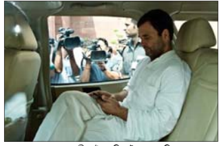
কংগ্ৰেসকী আইস প্ৰিন্সেণ্ট ৰাহুল গান্ধি

টুইটৰ একাউন্ট অদুদী মফু ফৰা ৰায়েলিঃ খঙদেৰুবা থিগৎপা ধৰক চখরি। দিল্লিৰী লেফটিনেণ্ট গৰ্ভাৰ নজিৰ জংগা দিল্লি পুলিসকী ওকিঃখিন্দা অদুনা হিৰম অদুদী মতাংদা এজন লৌখবনা খবখি হাৰখি। পুলিসনা হায়, হেক তৌখি হাৰবা চিনবা আই পি এফে ক্ৰে কৌনবা হৌনখি। লোয়না চঃপ চৰবা মফম খঙদেৰুবা হৌনখি। কংগ্ৰেসকী লুচিবো ৰাঃগৌই