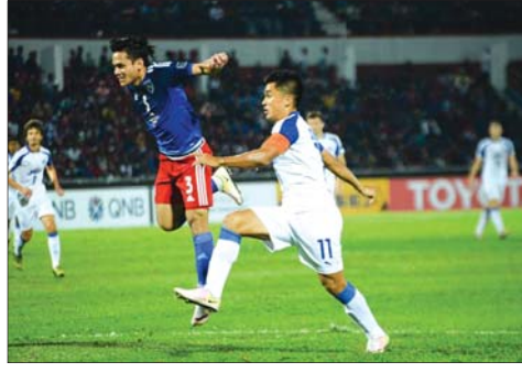
বেঙ্গালুরু এফসিৰ প্ৰায়োগী স্ক্ৰিন ছেট (ওই) না জিৰিটীয়া শাৰোই অহনা বেলে মুৰা

বেঙ্গালুরু, ওক্টোবৰ ১৯ ইন্দিয়াগী কৰ্ণাটক ৰাজ্যী বেঙ্গালুরু মহানগৰীয়া প্ৰিমিৰ লীগৰ প্ৰথম পৰিচালনা