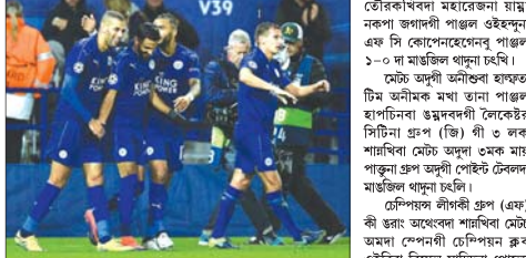
টোকেষ্টৰ সিটনা শাৰোইশিৰীনা পাছল ছাৰবা মুৰুনা হাৰকনা বেলেবেকনা

লন্দন, ওক্টোবৰ ১৯ যুৱোপকী ফুটবল শাৰবা লৈকাৰ্শিৰী ক্লাবশিৰী ওইবা