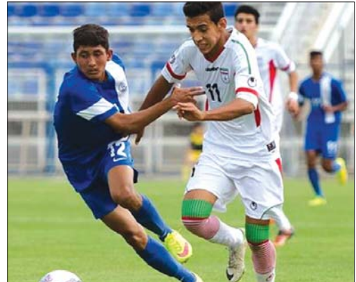
ইৱান অমসুং ইন্দিয়া শাৰাখিবা মেচো শাৰায়েই অমীনা বেলা সুৰা

গোৱালী সৰহ মার্গাওদা লৈবা পনিত জৱাহৰলাল নেহেৰু ফুটবোল ষ্টেডিয়ামত উসি শাৰাখিবা এশিয়ান ফুটবোল কনফেডাৰেচনগী চী ১৬ মখাৰী ফুটবোল চেম্পিয়নশ্বিপগী গ্ৰুপ (এ) গী অমস্ত্ৰা মেচোৰা ইৱানগী মখুত্রা পাঞ্জল ৩-০ দা মায়থিহৌবদগী স্টেপাইন রোভর্স নোক আওট স্টেজ যৌবা গুমাথিদ্ৰে।