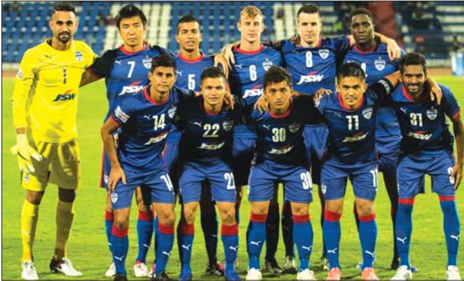
এ এফ সি কপ ফুটবোল টুৰ্ণামেণ্টৰী অলিম্পিক অনিশ্ববা লেগত ইন্দিয়াগী ফুটবোল পুৱাৰিদা ৱেকোৰ্দ থমস্ত্ৰে

সিঙ্গাপোৰ, সেপ্টেম্বৰ ২১ঃ ইন্দিয়াগী মজ্ঞ ওইৱাৰা বেঙ্গলুরু এফ সি অমসুং ইন্দিয়াগী সিন্ধাপোৰগী ফুটবোল টুৰ্ণামেণ্টৰী অলিম্পিক অনিশ্ববা লেগত ইন্দিয়াগী ফুটবোল পুৱাৰিদা ৱেকোৰ্দ থমস্ত্ৰে। ইন্দিয়াগী ফুটবোল পুৱাৰিদা ৱেকোৰ্দ থমস্ত্ৰে। ইন্দিয়াগী ফুটবোল পুৱাৰিদা ৱেকোৰ্দ থমস্ত্ৰে। ইন্দিয়াগী ফুটবোল পুৱাৰিদা ৱেকোৰ্দ থমস্ত্ৰে।