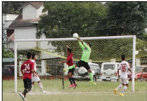
এফ সি জালেন অমদি এ আই এমনা শান্নখিবা ২১শুবা রাউন্ডগী মেটচকী মতাং অমা

ইস্কান্দা, ওক্টোবর ২১ : ইস্কান্দারী মণ্ডলা কাকজবুদা চতুর্থিবা ১৩গা মণিপুর ষ্টেট লীগকী ওসি শাম্বেবা লীদা রাষ্ট্রন্দরী অরোইবা অমদি ১১শুবা রাষ্ট্রন্দরী শাম্বেবা দেওতেশিংবা এ আই ই লমাইবা অমদি এ সি জায়েন সদর হিলস গোল অমত্তা চয়েন্দা গো ওয়েন্দে অমসুঃ বেঙ এ সি চুড়াচাচুগুর অমদি যু এ সি এ খুৰাই লীগ ২-২ শা গো ওয়েন্দে। লীগ অসিমী গেম্‌পনগরী মোটচতা খেংনগদা টিম মিশি কমল খাভা উময়ে। টিমশিঃ অদুদি মোট এচা শাৱগদা গাংলিবা দেৱাকী এঙে সি শাওকাকচ নোৱোক ২১।