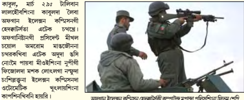
অফগান ইলেক্সন কন্মিসন হেফ্ৰেইকী কণ্ণাউম মপান পুৰিসশিপনা ফিভম পেট্ৰি

কালুৰ, মাৰ্চ ২৯ঃ টালিসন লালৌৱেইশিপনা কালুৰনা লৈবা অফগান ইলেক্সন কন্মিসনৰী হেফ্ৰেইকীসত্ৰা এটেক চখশ্বে। অফগানিস্তানগী প্ৰসিডেণ্ট মীথল চয়াল অৱোম মাড্ৰজৌনা চখৰকৰিবা এটেক অমদা ডি নোৱে পায়বা মীওইশিপনা নুপীৰী ফিজোলানা মশক লোংলগা নক্ষুৱা চশিনশ্ৰে। ইলেক্সন কন্মিসনদা ওটোমেকি খুংলায়শিপনা কাপিনিসিৰিবা হায়ৰি। অফগান পুৰিসকী পিপিসিয়েল ফোৱেনশিপসু এটেকশ্ৰমি অদুৱা মাৱোজকুনা অমম নত্ৰগা মৱিদি হাংপা জমত হায়না পুৰিসদা ফোডসেকত্ৰ। অফগানিস্তানগী কোমুঃ অসিদা মকওঁৱনা ফোৱেন এম ৱাৰ্কৰকশিপনা অৱাধা লৈবা সেট্ হাউট অমদা এটেক চখশিবা মত্ৰ নোৱা কোৱনবা চশিনগী এটেক অসি কোৱনবা চশিনগী। টালিসন ৱাৱোজোই চাৰিবিজ্ঞান মুজৱিটনা ওচিনগী এটেক অমু মথোৱনা চখশিবা হায়বা ৱাফম বি বি সিদা কনফাৰ্ম জৌৱকশ্ৰে হায়ৰি। কালুৰ পুৰিসকী মকোক চেমেল ৱাৱেইশিপনা এটেকশ্ৰমি অদুগী মৱজৰী অৱমদি সিকুৱিট ফোৱেনশিপনা নোৱেইনা কাপ্তাৰ শিৱে হায়না বি বি সিদা ফোডসেকত্ৰ হায়ৰি। এটেকশ্ৰমি অমু ৱোকেট প্ৰোপেল্ট