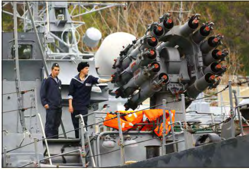
রুসিয়ান নেভী জাহাজ অমলা পানবা আৰ্মি অমগী মনাজা লানী অনি লেজি

জেমলিন, মাৰ্চ ২৯ঃ মোয়েনা লানী যুক্তেনদা যুক্তেনদা সৌশিলবী অনিবা অমতা লৈতে হায়না রুসিয়ান ফোৱেন মিনিষ্টৰ সৰ্গে লাভোৱেনা ফোডসেকত্ৰ। অনুৰূপে হায়না ফাওনবা যু এম এফিসিয়েলশিপ পাৰা যুক্তেনদা যুক্তেনদা জমি মনাজা যুক্তেনদা রুসিয়ান লানীশিপ অসি চাওৱাজা লিপিঃ ৪০ ৱোমদি স্তৰগনি হায়নবা লোৱেননা মহৌশাণা মায়ানা লানী পেশিলক্লিবা অসিবা যু এমদা