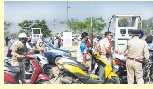
ইন্দিয়া পুন্না চখৰিবা টোটেলে কোৱাৰ্টাৰ অমসুং মণিপূৰী কৰ্ফু মনুংদা ইন্দিয়ালৈবাল সার্ভিসতা থবক তৌৱিবশিংদা বিকুপুৰ দিল্লীতকী মোহিৱাংদা লৈবা মোটোৱে সার্ভিস স্টেশন মোহিৱাংদা পেণ্ড্ৰেল পীৰগী শত্ৰম