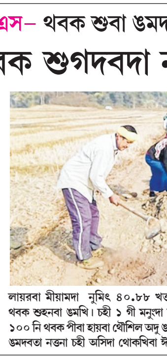
লায়ৱা মীমুংদা নুমিৎ ৪০.৮৮ খঙমক থবক শুন্দনবা উম্ৰাযি। চহী ১ গী মনুংদা নুমিৎ ১০০ নি থবক পীৱা হায়াবা যৌশিল অমু ডকপা ওমদবতা নকতা চহী অসিদা থোকখিবা ঙকংদা

ইফাল, মাৰ্চ ৩১ (এস এন এস) : লৈবাক অসিগী লায়ৱা মীমুংদা লৈডাৱুৱা গাৰ্ভী ৱেসেল ৱেল ইম্প্ৰাইমেণ্ট গোটটি ফিমি (এম জি এন আৰ ই জি এস)গী মখাদা চহী অমগী মনুংদা নুমিৎ ১০০ নি অমসুং ঙকং থোকখিবা অতোপ্লা নুমিৎ ৫০ নি অমগা থবক শুন্দনবা মণিপূৰ লৈডাৱুৱা মাঙজিনা খঙনখিবা লৈৱগু শুপ্ততী নুমিৎ ৪৯ থবক থবক পীৱগা কুমাৰী ২০১৯-২০২০ লৌইশিন্বে।