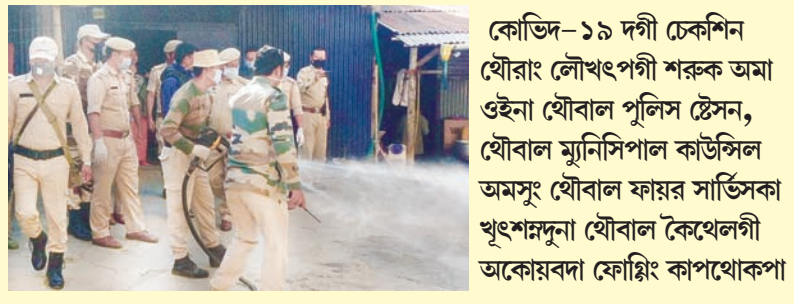
কোভিড-১৯ দগী চেকশিন যৌৱাং লৌখংপগী শৰুক অমা ওইনা যৌবাল পুলিস স্টেশন, যৌবাল মুনিসিপাল কাউন্সিল অমসুং যৌবাল ফায়ৰ সার্ভিসকা খুংশমদুনা যৌবাল কেংথেলগী অকোয়বা ফোণ্গি কাপাখোকপা