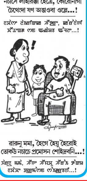
ৱাৰুনা মমা, হেণ্টে হেণ্টে হেৰেই হেণ্টে ন্যচে প্ৰশ্নোম শৌহিবনি...!

লেপুৰা মীমুংদা পাউচে য়েহোকপা থবক হায়ে এপ্ৰিল ১দগী মহৌশাওম য়েহোকপা হৌৱগনি।