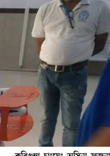
জয়পুৱদা লৈবা গভৰ্ণমেন্ট হোম্পিটাল অমনা হোম্পিটাল অসিনা অসি চল্লকখিবা কোৱাৰাণ্টাইন অনাবৰশিবা চিজাক অমসুং হিলাকখিবা পীহুদনা লাইচং অসিগী মায়োক্তা ৰোবোটনা মতুং ওইবা য়াণ্ডা হায়দু যেনবা ৰোবোট অমা চাংয়েংখ্ৰে।