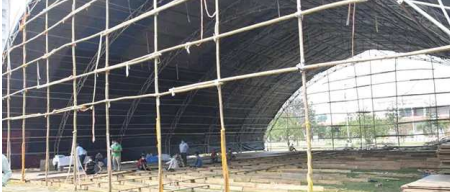
সেণ্টাৰটো অমসুং কোৱাৰাণ্টাইনসকী মীওই খন্তগী ওইনা শিজিমনবা হোম্পিটাল খৰা থদবা সেন্টৰনা ষ্টেটমিৎতা খেঙহল্লকখিবা মতুংতা অসামনা খোঙাং অসি লৌখৎলকখিবনি।

৩৬হাটি, মাৰ্চ ২৬(বেজমি): অসাম গভৰ্ণমেন্টনা কোভিড-১৯গী অনাবৰশিঃ থদবা অটোবা ক্বাৰেণ্টিন সেন্টৰ অমা শাগংলি হায়না ষ্টেট মিনিষ্টৰ হিমন্ত বিশ্ব শৰ্মনা ষ্টিট তৌখ্ৰে।