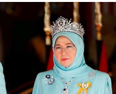
মহাক্কী লৌনবী অদু কোণুংগী ষ্টাফ অদু কোভিড-১৯ পোজিটিভ ওইবদগী ক্বাৰেণ্টিন তৌখ্ৰে।

ষ্টাফ ৭ অদু লৈবাকপোকপা নুমিৎতা হোম্পিটালদা পুখৎখি অমসুং মথোয়না লাইচং অদু লৌয়নবীকখিবা হৌৱকফম অদু হেলথ ওথোৱাৰিটজনা খনবা হোংনৰি হায়না ওসি কোণুংগা হায়খি। কিং সুলটান অৱদুল্লা সুলটান অহমদ শাহ অমসুং মহাক্কী লৌনবী তুংনু অজিজাহ অমিনা মাইবুনাহা ইনস্পাৱাৱিয়া ভাইৱস অদুগীদমক চাংয়েংখ্ৰে অদুৰু মথোয় অনীদমক ভাইৱস অদু পৰকমশ্ৰে।