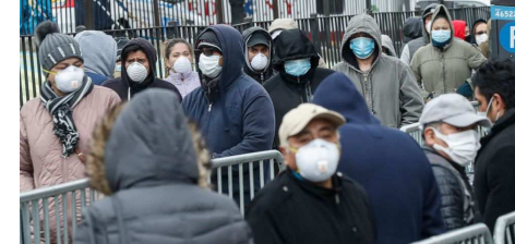
মথৌ-মঙম তৌৱবসু লৌৱোনে জনবগীদমক মহাক্কী হক্কাং ঐচাৰা কু অদু পুৱকখিবা মীয়ামনা মথোয়গী মুমগী বেলকোনিশিৎদগী অৰাবা অমসুং ঈকাইখুমা ফোঙদোকখি।

মহাক্কী মশক খুদবা কোভিড ১৯না নাবা অনাবা নহা অমদা মহাক্কী ৰেস্তিৰেটৰ পীখিবা মশাগী চহী ৭২ স্তৰবা লাইনিংহন অমা কোৱাৰাণ্টাইনতগী শিখ্ৰে।