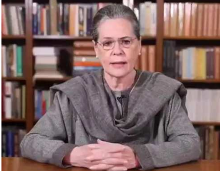
কোংগ্ৰেচসকী প্ৰসিডেন্ট ওইনা ঐহাৰা হায়বা পান্দ্ৰমিক অসি শৌয়দনমক লাঞ্জিগবা যুনিয়ন গভৰ্ণমেন্টনা লৌখৎলিবা খোঙাং খুদিমক ঐখোয়না শৌগৎকনি অমসুং মপুং ফানা শৰুক য়াণ্ডা হায়না লমাই ৪গী চিটি অদুনা সোনিয়া গান্ধীনা ইবি।

মু দিল্লি, মাৰ্চ ২৬(বেজমি): কোংগ্ৰেচ প্ৰসিডেন্ট সোনিয়া গান্ধীনা ওসি নুমিৎ ২১নিগী নেসনেল লোকদাউন অদু তৱাৱা ওক্ৰিঃঙাই ওইবা খোঙাং অমনি হায়দুনা প্ৰাইম মিনিষ্টৰ নৱেস্ত্ৰ মোদিলা শৌগৎপা চিটি অমা লৌয়ননা কোৱাৰাণ্টাইনসকী মায়োক্তা থেনবদা শেন-থুমগী অমসুং খুনাইগী ওইবা থৌৱাংখিঃ লৌখৎনবসু হৌদোক্ৰে।