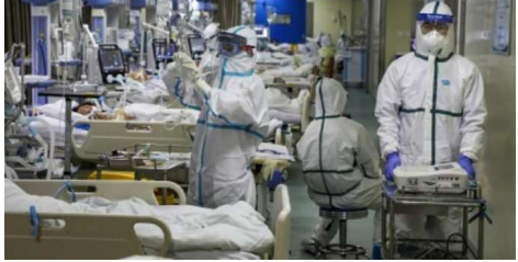
বৈজিং, ফেব্ৰুৱাৰী ১৬(এজেন্সি):