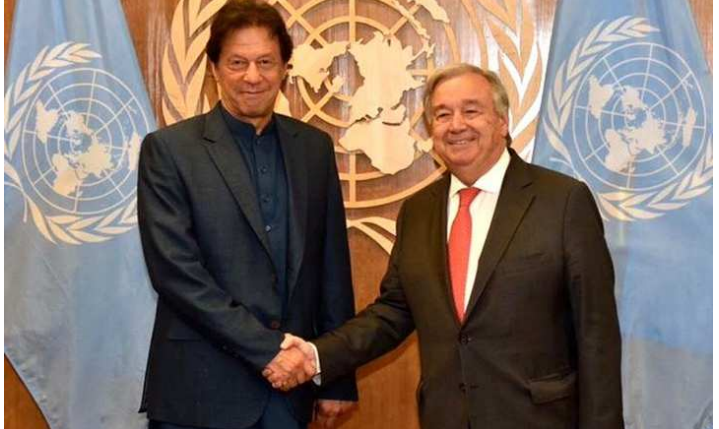
ইয়াৰাবাদ, ফেব্ৰুৱাৰী ১৬(এজেন্সি):

নুমিং ৪নিগী খোঙচৎতা যু এন চীফ পাকিষ্টানদা থুংস্তে।