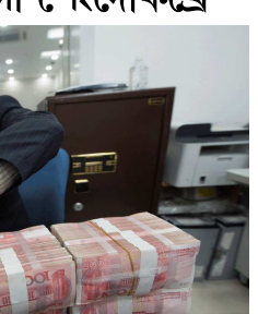
সিটেংগা, ফেব্ৰুৱাৰী ১৬(এজেন্সি):

লাইচং থিংনবা বেব্বনোটিশিং থোক্সে বুক্ৰিদিদা হকচ্যাং ৬,০০০ হোৱা হৰং।