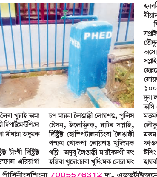
চপ মাৱনা লেজিকী লোয়শঙ, পুলিস টেসন, ইলেক্ট্ৰিক, ৱাটৰ সপ্লাই, দিল্লি হোম্পিটালচিবা লেজিকী থফম থোকপা লোয়শঙ খুদিমক থগি। অদুব লেজিকী মায়েকেশগী ফং হন্বাৰা খুদেচোবা খুদিমক ওদা...

ইফাল, ফেব্ৰুৱাৰী ১৪ (এস.এন.এস): মণিপূৰ লেজিসলেটিভ এসেমব্লীগী ইঞ্জিনিয়াৰিং ডিপাৰ্টমেন্ট (পি এচ ই ডি) তমংলোংগী ৱাটৰ সপ্লাইনা থক্ৰ-চনবা অৰুবা ষ্টিং কঞ্জুৱৰশিংদা অমদি লেজিকী লৌইশঙ, ক্ৰাউশিং দা চয়াল অমনা অনীৱক ষ্টিং ফং হনহৌৱি। অদুব কঞ্জুৱৰ ওইনবা ইমু কয়ানা নাৱোলদা পাইপ হুংলগা ষ্টিং পাইপ পুৰ্শিৱা অসিগী মৰম ওইৱগা কঞ্জুৱৰ ওইজবশিৎদে ষ্টিং নীংনিবা ফংহনবা ডমহৌৱি।