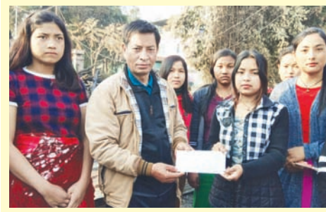
ফেব্রুৱাৰী ১১ অমদি ১২ গী লোয়াৰা অহিৎবা মৈনা চাক্তৰবা টি এন মেমোৱিয়েল ইংলিশ স্কুল অমদি বোদিংগী মীছংশিংদা নিঙেল ক্লব হৈৰোকী খৌমিশিংনা চংতুনা শেলগী তেংবাও খুংশিমাখিবগী শক্তম