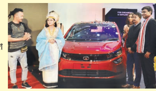
টাটে মোটোৱসনা নৌনা পুথোকপা লকজৰি কাৰ অলাগোজ টাটে মোটোৱস লিমিটেদকী ৰিজনেল মেনেজৰ সৌমেন পাউডনা ইফালগী কাঁকেথেলদা লেবা টাটে মোটোৱসতা লোখ তৌবা