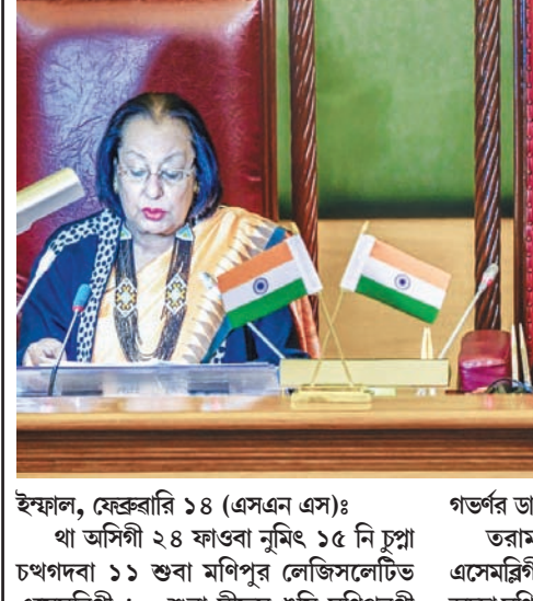
ইফাল, ফেব্ৰুৱাৰী ১৪ (এস.এন.এস): ষা অসিগী ২৪ ফাওবা নুংতি ১৫ নি চুপ্পা চংখাদবা ১১ শ্ববা মণিপূৰ লেজিসলেটিভ এসেমব্লীগী ১০ শ্ববা মীফম উসি মণিপূৰগী গৰ্ভৰ অ নজমা হেপ্তুনা হৌদোকস্বে।