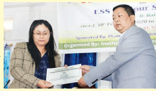
ই এস এস মণিপূৰ ট্ৰাট অপকী অনীশ্ববা ৱাউদ অমদি অনীশ্ববা বোটেচকী ব্ৰেনিং শ্ৰোৱাণাম লোইশিনবগী খৌৱমদা ব্ৰেনিংশিংদা এম এস সি বিগী মেনেজিং দাইৱেস্তৰ এ সূভাশনা সাঁফিককেট য়েছোকথিবা