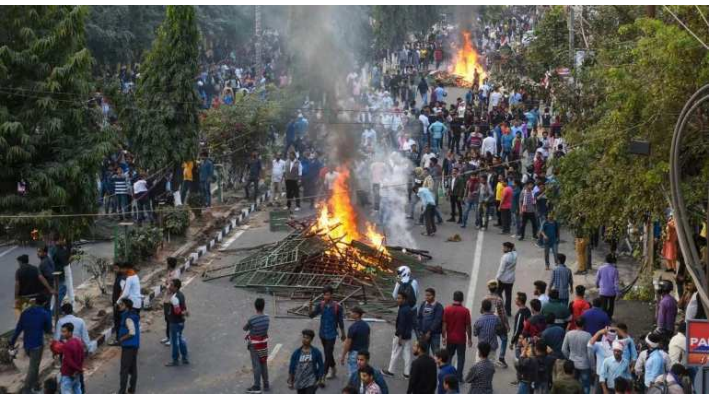
গুৱাহাতি/আগৰতলা, দিসেম্বৰ ১২ (এজেলি):