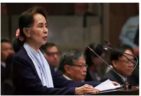
দ বেগ, দিসেম্বৰ ১২ (এজেলি):