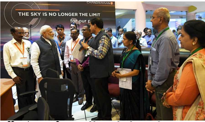
নু দিল্লি, সেপ্টেম্বৰ ০৭ (এজেন্সি):

পোলিটিকেল পাৰ্টি প্ৰমুখৰ লুচিংবশিংনা ইশ্ৰো সাইন্টিসশিং কথোকপা অমসুং অচেংপা অনিবা অদুগীদমক থাগৎশ্ৰে অমসুং থাগী লোমাইদা অগদবা খিজিঙা ঙাইবৰা মতমদা গ্ৰাউণ্ড ষ্টেশ্যনগা চক্ৰয়ান - ২ গী ব্ৰিক্ৰম লেন্দৰগা পাউ ফাউণ্ডেশ্যনগা অদুগী মতমদা আশা কাৰয়নবা মখোয়দা আপিল তৌশ্ৰে।