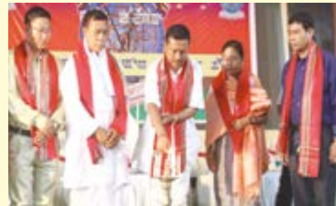
মণিপুৰগী ইৱোল-ইয়েক নৌনা হিঙ্গংহনবদা অমসুং মণিসু চংহনবা হৌংনবদা অটোবা যৌদাং লৌদুনা লাকথিবা মীলাল লিংখংখিবগী ১৬ শুবা মাপোক কুমওন থৌৱম হৌদোকপগী মেৱা চুখংপা