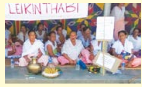
স্টেণ্ডৰ্ড ৰোবাৰ্ট হায়ৰ সেকেন্দৰী স্কুলগী ৰোবিন্সন মৌহোৰেই বেবিসনা শিৱগা ফণ্ডাৰেবা চেমবা মীওইশিং পুথোকট হায়বা দিমাদ তৌৱদুনা অৱাং লৈকিনথবিনা মীয়াগা ৰাকং মীফম ফণ্ডগী শক্তম