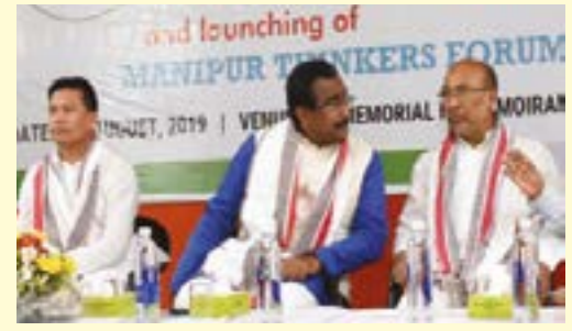
বিষ্ণুপুৰ দিষ্টিকটী মোইৱাংদা লৈবা ইন্দিয়ান নেলেৰ আৰ্মি (আই এন এ) গী মেমোৱিয়েল হোলদা পাণ্ডথোকপা মণিপুৰ থিঙ্কৰস ফোৱম থবক হৌদোকপা থৌৱমগী শক্তম অমা