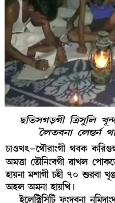
ছত্ৰসগড়গী ত্ৰিভুংলি খুন্দা অজাশিনো উপাই অমত্ৰা লেভতৰনা লেভতৰ থাৰুনা লাইৱিক উৱাইৰি

বলৰামপুৰ, জুন ১৩(এজেলি): ঐখোয়বু হৌজিক ফাওবা অমদা মৱত্ৰা লৈহায় হায়না ছত্ৰসগড়গী অৱাণা অমসুং মনু হঞ্জিননা মফম ত্ৰিভুংলিগী খুঞ্জাশিনো কোঙডোকথি।