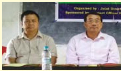
ভৌটিনাৰি সেনাপটি দিষ্ট্ৰিক্টকী জেইন্ট দাইৰেক্টাৰনা শীন্দুনা ওইনাম হিলাস ভিলেজদা পাঙথোকপা আৰ্টফিসিয়েল ইন্সেৰ্ভমেসন হায়বা হিৰমথা খাম-নৈনবগী খৌৰমগী শত্ৰম অমা