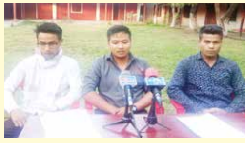
মণিপুৰদা শাশিনবা সার্কিফিকেট লল্লোন্দুনা এদুকেনবনু শেপান লম্বী ওইনা চখবা গেঙ খুংপু অমা লৈরে হায়বা থিঞ্জিবদগী খঙবা গুপ্তে হায়না এইমসকী প্ৰসিদ্দেট ৰাজেস য়ুলামনা পাউমীশিংদা ফোঙদোকখিবা