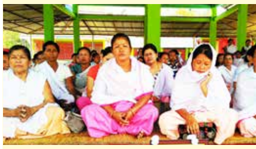
শকুণ্ডবিশিষ্টা তমথিনা ফুন্দা হাংলবা মতুন্দা লং থোকপীৰনা ডাকয়েল খোঙাবাল মনিং লৈকাইদগী অয়েকপম বেদজিৎকী মীশিগীনা চেনবশিং পুথোকউ হায়দুনা নুপীশিংনা বাকং মীফম ফমবা