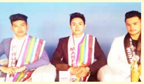
মিষ্টৰ ইন্দিয়া এন্দ মেজিষ্টিক ইন্দিয়া ইন্টাৰনেচনেল তারকখ্ৰবা অমদি মণিপুৰ যুনিভাৰ্চিটি মেনফিট ২০১৯ তারকখ্ৰবিশিষ্ট মল্লা মল্লা লেনুশিগী শ্ৰোজেট ডাইৰেক্টৰ সি এচ দিল্লিপনা তৰান্না ওকপগী থৌরম