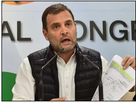
হৰুলাগান্ধীনা নেগোসিয়েট তৌখিবা অদু সুপৰভিজন নং৩ত, মদু খুং থিংজিবন হায়না কোংগ্ৰেছনা মৰৈ য়েংখি।

পাৰ্টিটিক্‌ফ হাৰুলা গান্ধীনা শেমজিন শাজিনবা মীনম্বশিং হায়না লিষ্ট অমগা লোননা কোংগ্ৰেছকী মখজা বি জে পিনা ঙসি খুং হুংদা চৈত্ৰে।