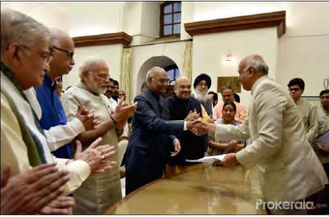
নু সিলি, জুন ২০

ভাৰিয়া জমাট পাটি নি জে পিনা লুচিবা চুশিৰাৰা কাবুনা পুথোকপা প্ৰসিদ্দেট মীৰেপ ৰাম নাথ কোভিন্দ ৩টি পাৰ্টিয়ামেণ্ট হাউচত। নোমিনেসন ফাইল তোছে। নোমিনেসন ফাইল তোছে। নোমিনেসন ফাইল তোছে।