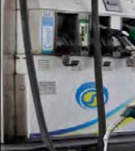
হায়দৰাবাদ, জুন ২০

চনচলগুৱা পেত্ৰোল জেল মনাজু লোবক অসিগী ৩নাব অহনবা নুপীশিংতা পৰক টোৰো পেত্ৰোল পম্প ৩টি হাংদোকছে। পেত্ৰোল পম্প অদুদা থবক হোৱাৰি নুপীশিং অমু চ্ৰেডাৰগী থাৰকশুশুশিগনি হায়াৰ।