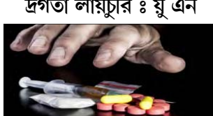
হিয়েলা, জুন ২০

মালেমগী মীওইশিংগী মনু চনবা চাদ হেদি শ্ৰাভ লাইচুৱি। অদুগা মীওই মিলিয়ন ৩০না ফিলাক মনগী হোংলকশিগা মশান জনা হিচি।