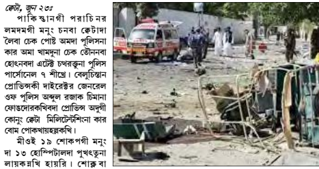
কেটে, জুন ২০

পাকিস্তানগী পৰাচিনৰ লমদমগী মনু চনবা কেটনা লোবা কে পোষ্ট অমদা পুৰিচনা কৰ অমা খানুদা কে জৌনবা হোংনবা এট্টে চুৰকুনা পুলিচ পাৰ্চেসনেল ৭ কীপে। বেলচিচান প্ৰেচিদ্দেট দাইৰেইটৰ জেনেলে এক পুলিচ অফুৰ ৰাজক চিনা কোভদোকৰখিবা প্ৰেচিদ্দেট অদুগী কৌনু কেটে মিলিটেৰিচিনা কাৰ বোম পোকখায়বদা।